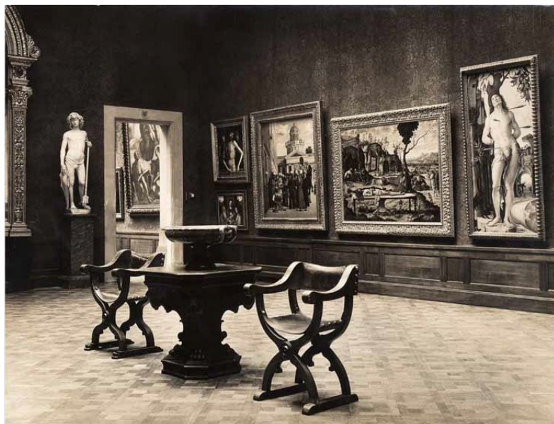
Fig. 8: Veduta della sala 46 del Kaiser-Friedrich-Museum di Berlino, 1910-1933 circa.