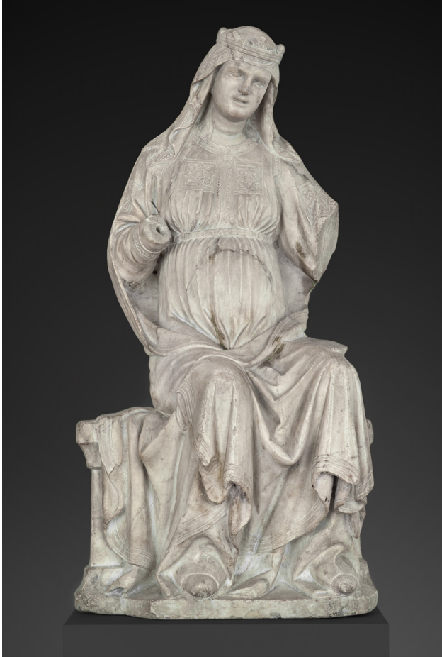
Fig. 2: Arnolfo di Cambio (attribuita), Madonna col Bambino , marmo, 1270 circa. Berlino, Skulpturensammlung und Museum für Byzantinische Kunst (esposta al Bode-Museum).