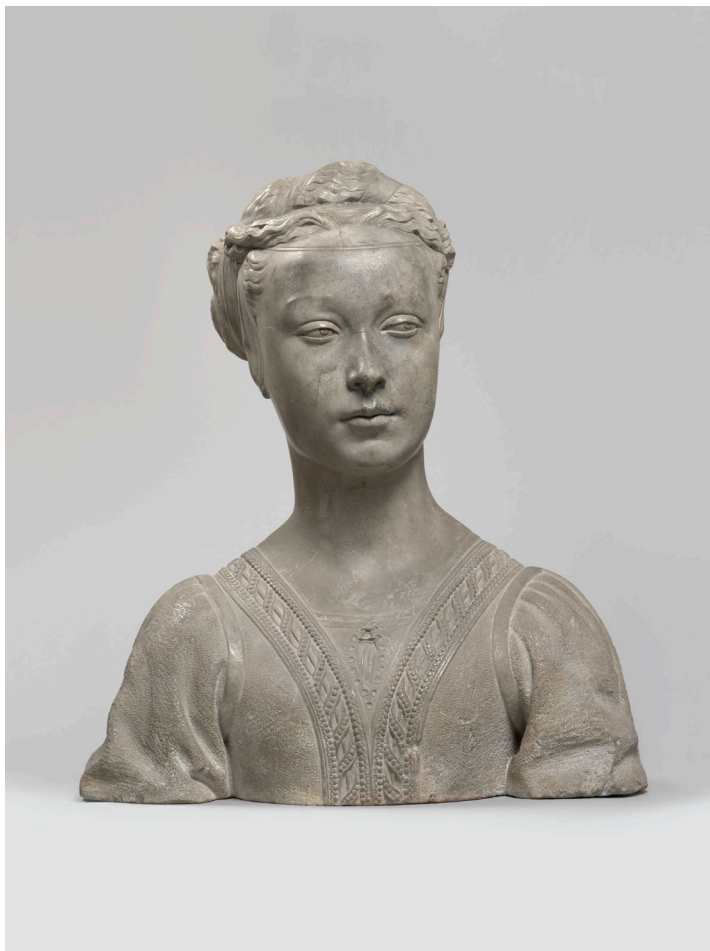
Fig. 6: Seguace di Desiderio da Settignano, Busto di gentildonna , detta la Principessa di Urbino , pietra calcarea da Urbino, 1460-1470 circa. Berlino, Skulpturensammlung und Museum für Byzantinische Kunst (esposto al Bode-Museum).