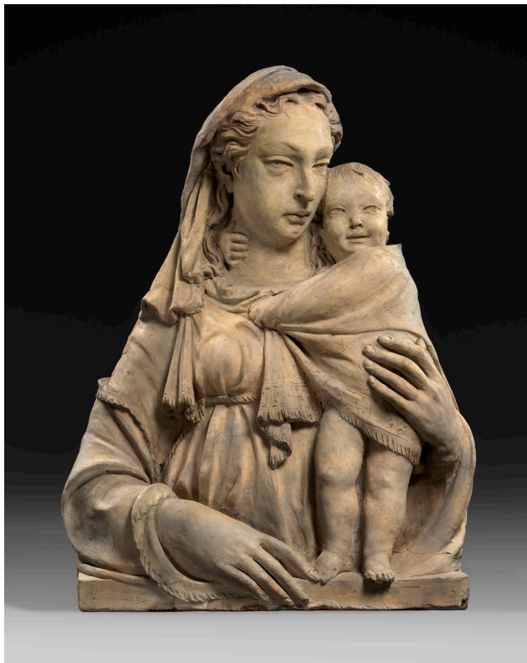
Fig. 5: Donatello, Madonna che tiene il Bambino avvolto nel mantello . Berlino, Skulpturensammlung und Museum für Byzantinische Kunst (esposta al Bode-Museum).