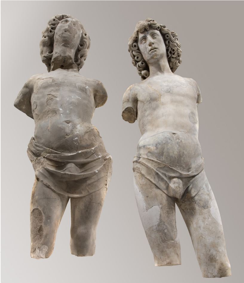
Fig. 7: Tullio Lombardo, Paggi reggiscudo, marmo, 1490-1495 circa. Berlino, Skulpturensammlung und Museum für Byzantinische Kunst (esposti al Bode-Museum).