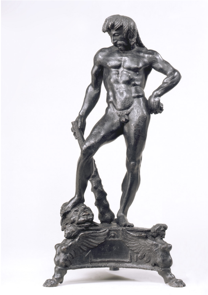
Fig. 3: Antonio del Pollaiuolo (attribuito da M. Knuth a Luca Signorelli), Ercole al riposo , bronzo, 1480 circa. Berlino, Skulpturensammlung und Museum für Byzantinische Kunst (esposto alla Gemäldegalerie).