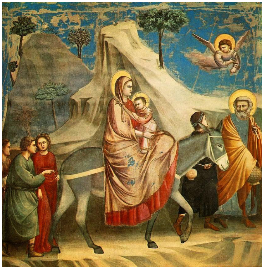
Fig. 12: Padova, cappella Scrovegni, Giotto, Storie di Cristo e della Vergine, Fuga in Egitto .