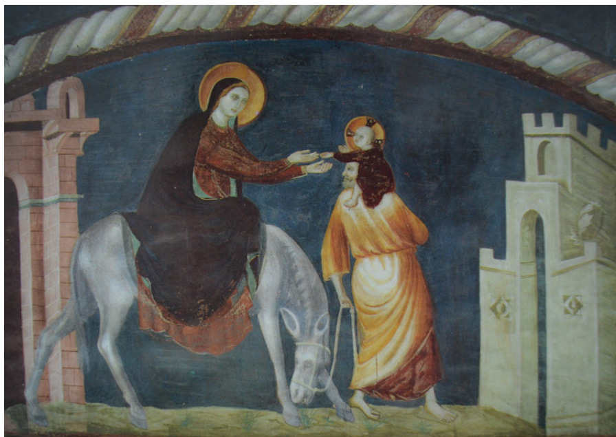
Fig. 31: Ferrara, Monastero di Sant'Antonio in Polesine, Cappella presbiteriale, Fuga in Egitto , prima metà del XIV secolo.