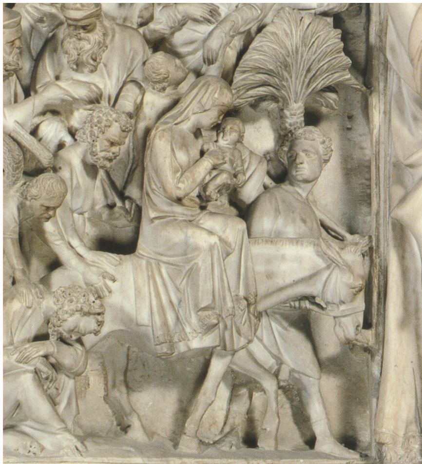
Fig. 14: Pisa, Duomo, Giovanni Pisano, Pergamo, Fuga in Egitto (?) (part.).