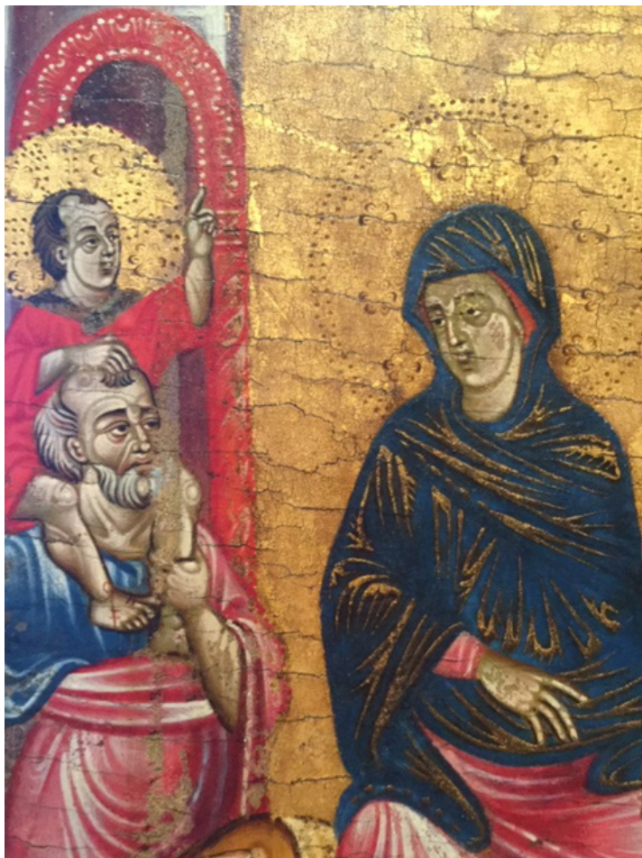
Fig. 24: Tabernacolo a sportelli (Trittico Marzolini), Fuga in Egitto (part.). Perugia, Galleria Nazionale dell'Umbria.