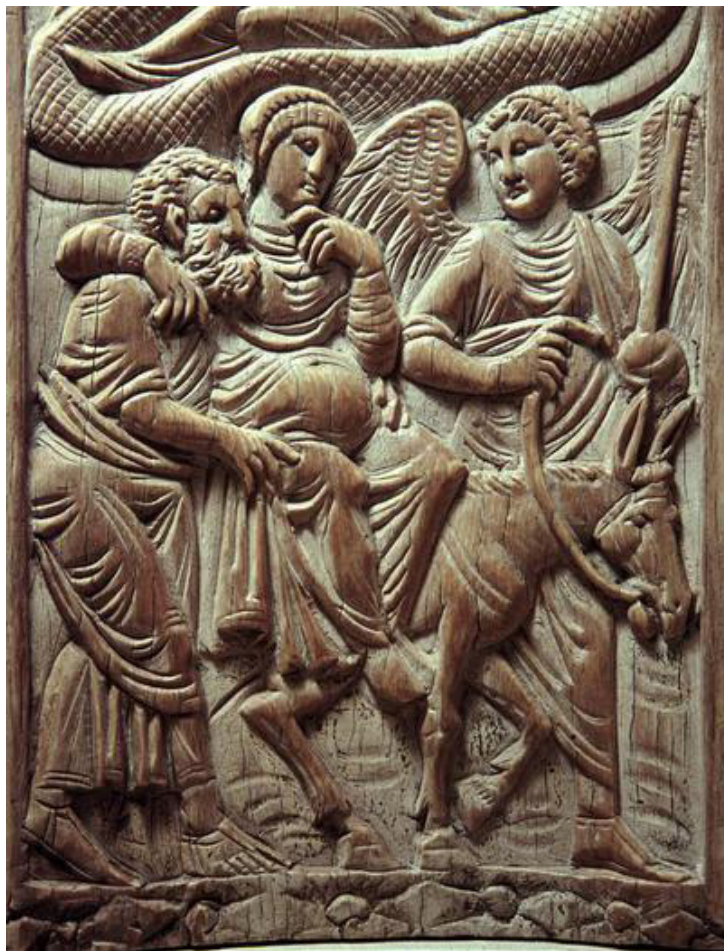
Fig. 1: Cattedra di Massimiano (part.), Viaggio a Betlemme. Ravenna, Museo dell'Arcivescovado.