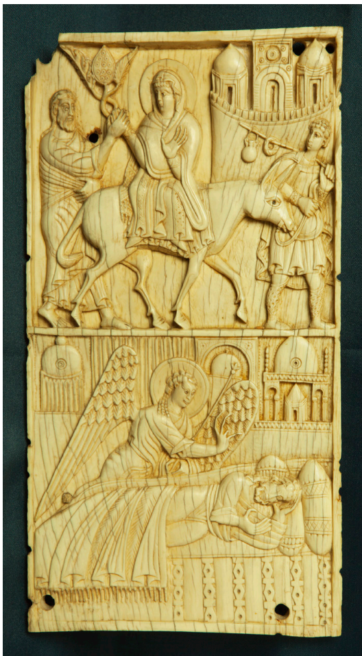
Fig. 3: Viaggio a Betlemme . Salerno, Museo Diocesano. Foto: V. Pace, Una Bibbia in avorio. Arte mediterranea nella Salerno dell'XI secolo , Castel Bolognese, 2016.