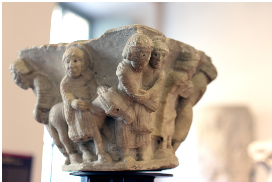
Fig. 28: Como, Museo del Duomo, Capitello con Fuga in Egitto (part.).