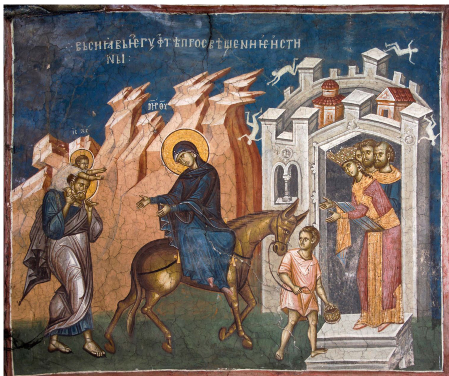
Fig. 18: Peja, Monastero di Visoki Dečani, Fuga in Egitto .