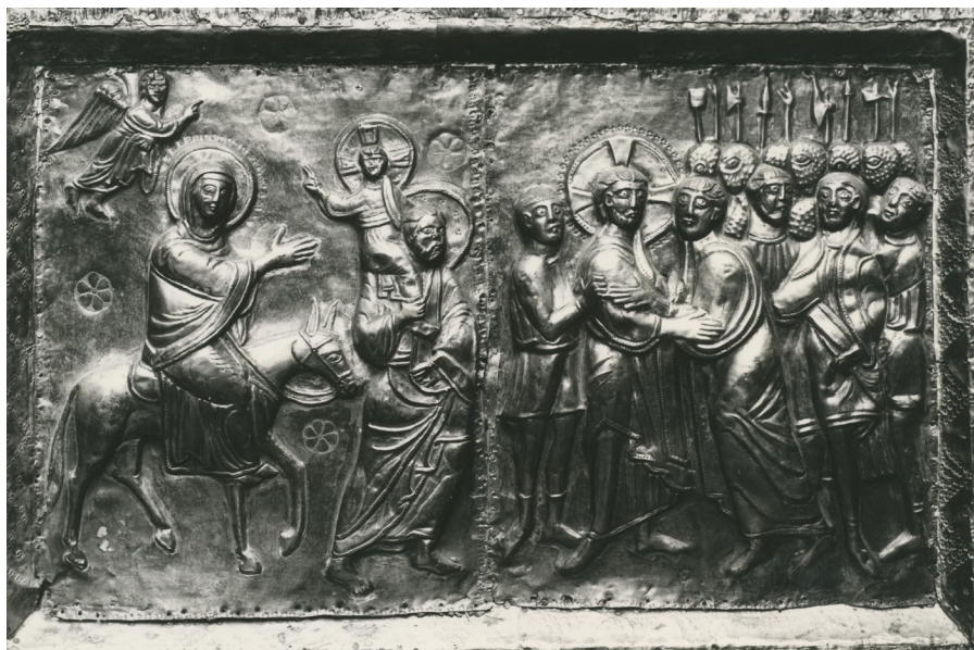
Fig. 27: Città di Castello, Museo del Duomo, Paliotto ( Pantocrator e Storie di Cristo ), Ritorno dall'Egitto (?).