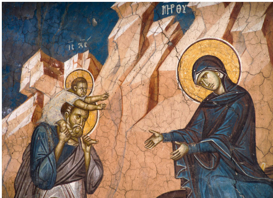
Fig. 19: Peja, Monastero di Visoki Dečani, Fuga in Egitto (part.).