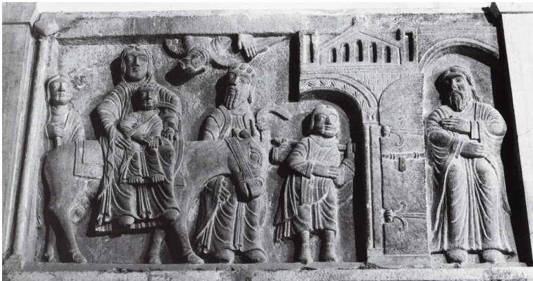
Fig. 8: Aosta, Sant'Orso, Chiostro della Collegiata, Capitello con Fuga in Egitto .