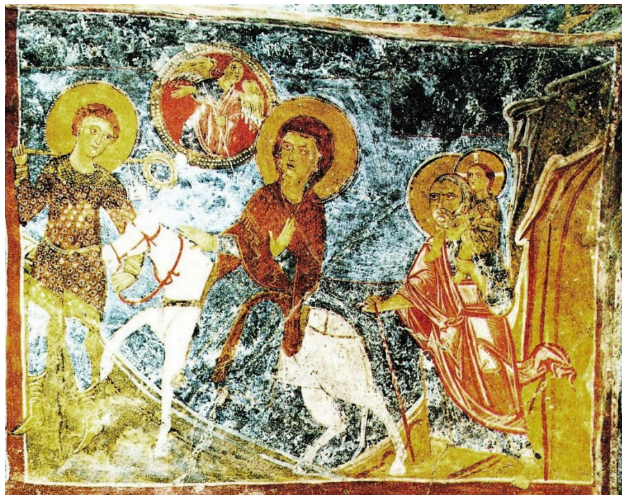
Fig. 22: San Vito dei Normanni, chiesa rupestre di San Biagio, Fuga in Egitto .