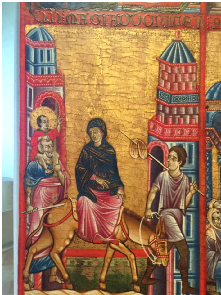
Fig. 23: Tabernacolo a sportelli (Trittico Marzolini), Fuga in Egitto . Perugia, Galleria Nazionale dell'Umbria.