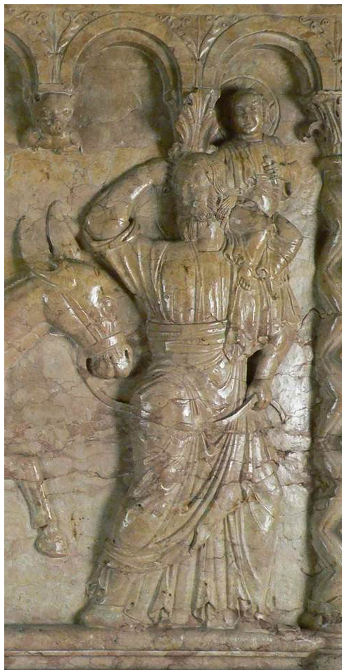
Fig. 30: Verona, Battistero, Fonte battesimale, Fuga in Egitto (part.).