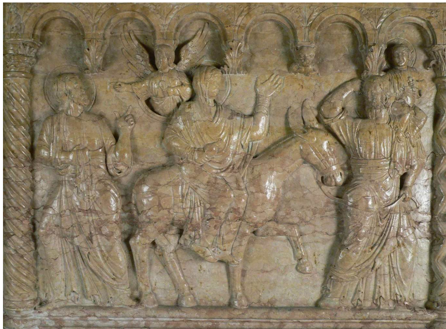
Fig. 29: Verona, Battistero, Fonte battesimale, Fuga in Egitto .