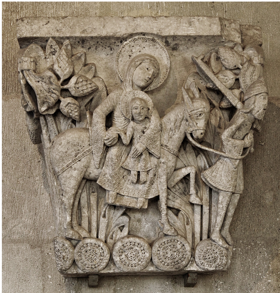
Fig. 10: Autun, Saint Lazare, Gislebertus, capitello con Fuga in Egitto .