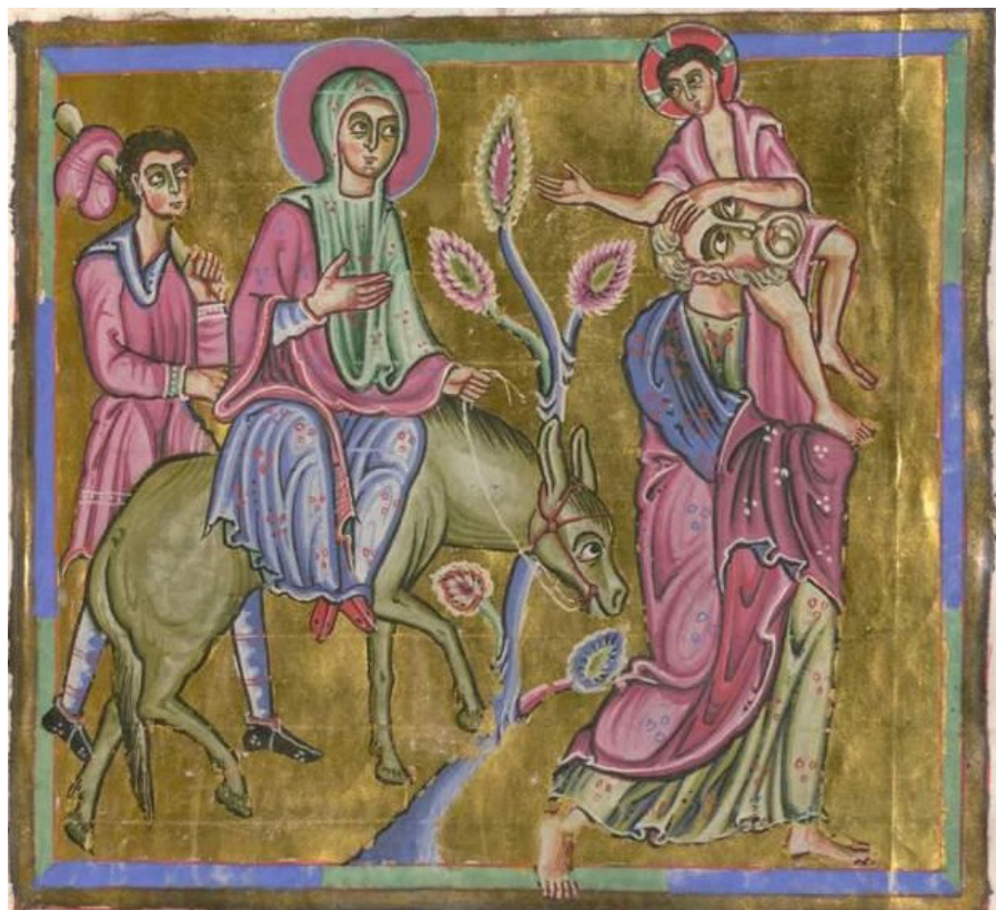
Fig. 25: München, Bayerische Staatsbibliothek (dal monastero di San Pietro a Salisburgo) Pericopi di Santa Erentrud, Clm. 15903, Fuga in Egitto .