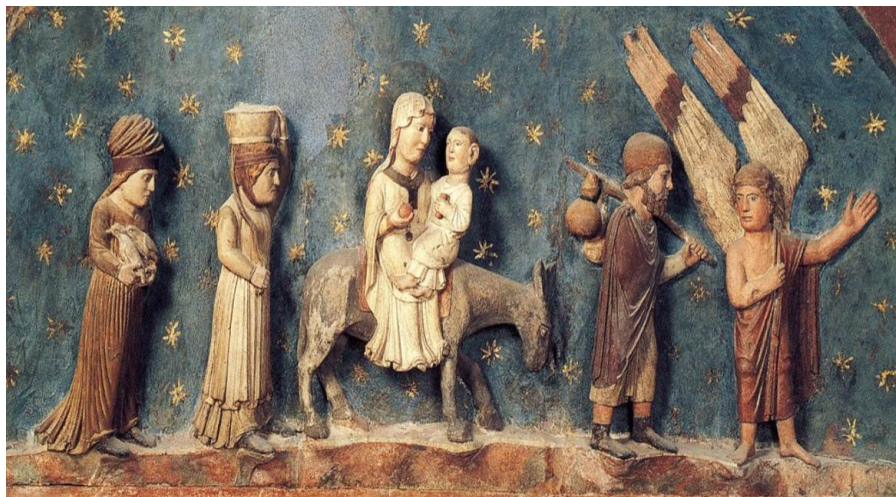
Fig. 15: Parma, Battistero, Benedetto Antelami, Ritorno dall'Egitto (part.).