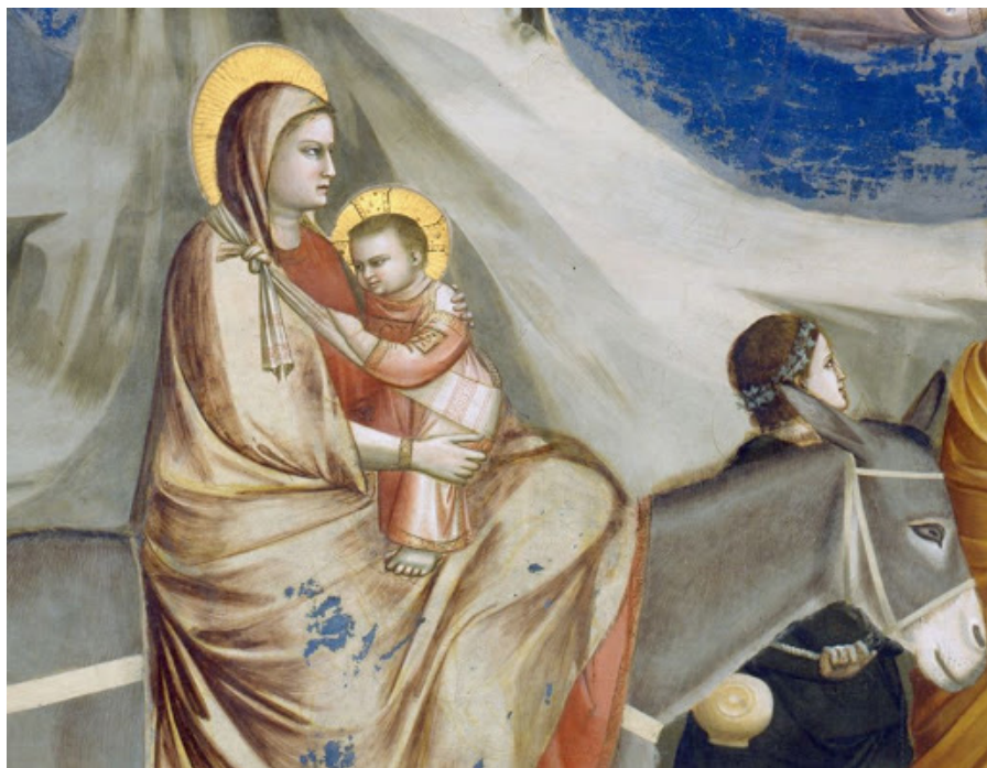
Fig. 13: Padova, cappella Scrovegni, Giotto, Storie di Cristo e della Vergine, Fuga in Egitto (part.).