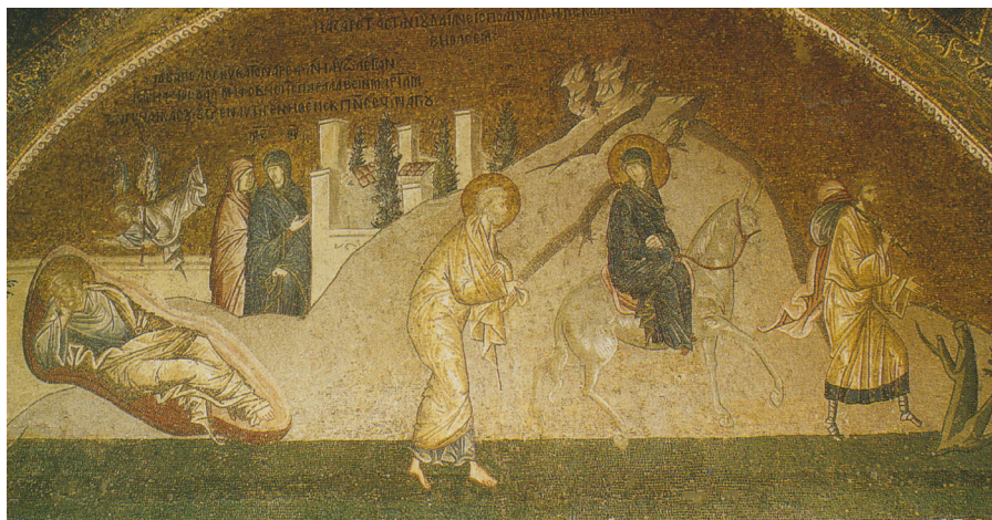
Fig. 16: Istanbul, San Salvatore di Chora, Esonartece, Avvertimento a Giuseppe e Viaggio a Betlemme.