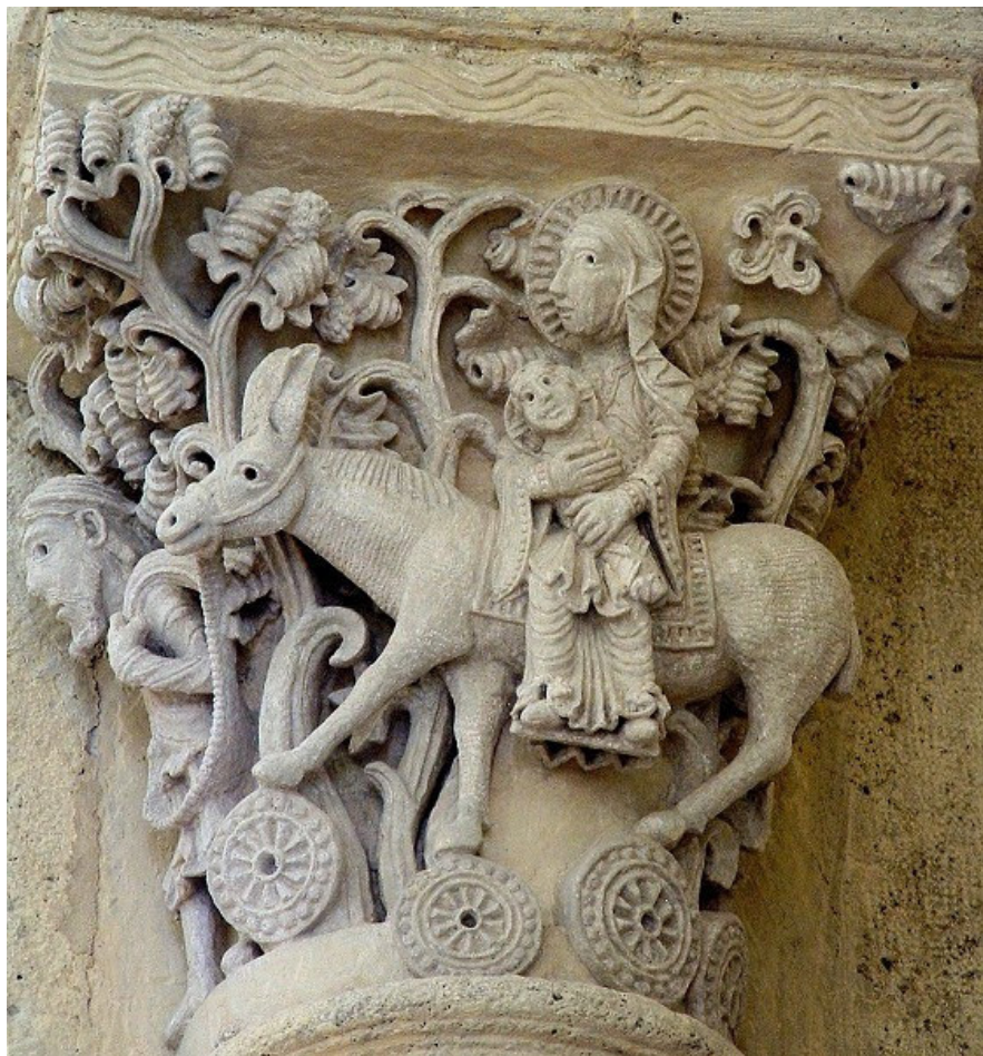
Fig. 11: Saulieu, Saint-Andoche, capitello con Fuga in Egitto .