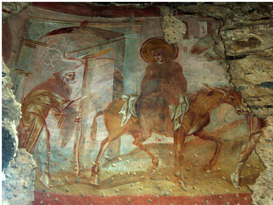
Fig. 2: Castelseprio, Santa Maria foris portas, Viaggio a Betlemme . Foto: https://delta-november.it/altro/vangeli-apocrifi/affreschi-castelseprio.html (CC BY-SA 4.0).