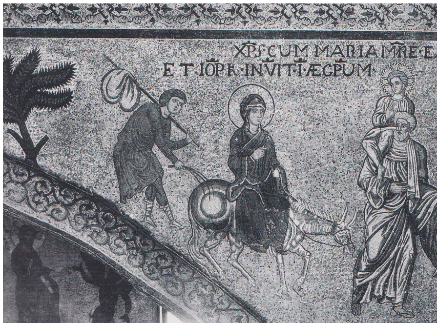
Fig. 21: Monreale, Duomo, transetto, Fuga in Egitto .