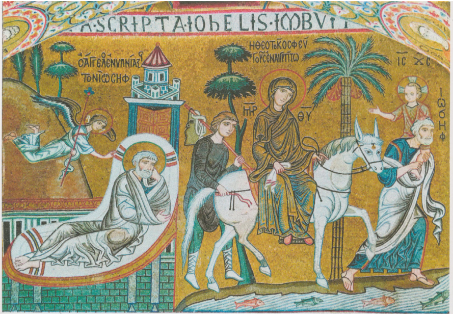
Fig. 20: Palermo, Cappella Palatina, parete destra, Fuga in Egitto .