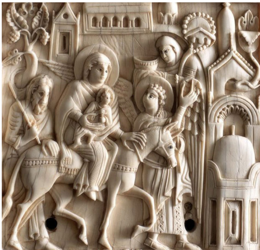
Fig. 4: Fuga in Egitto . Salerno, Museo Diocesano.