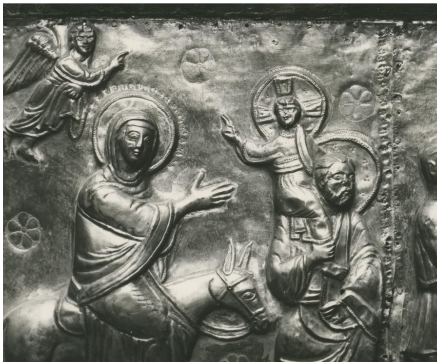
Fig. 26: Città di Castello, Museo del Duomo, Paliotto ( Pantocrator e Storie di Cristo ), Ritorno dall'Egitto (?) (part.).