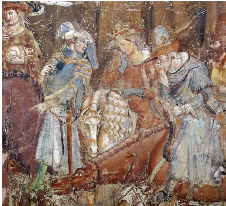
Fig. 32: Firenze, Biblioteca Medicea Laurenziana, Supplicationes Variae, Laur.Plut.25.3, Fuga in Egitto.