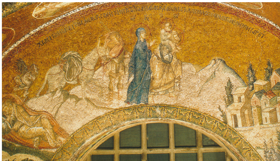
Fig. 17: Istanbul, San Salvatore di Chora, Esonartece, Annuncio a Giuseppe e Ritorno dall'Egitto.