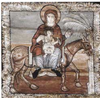
Fig. 6: Zillis (Canton Grigioni), Chiesa di Saint Martin, soffitto istoriato, settore con la Fuga in Egitto , pannello con San Giuseppe.