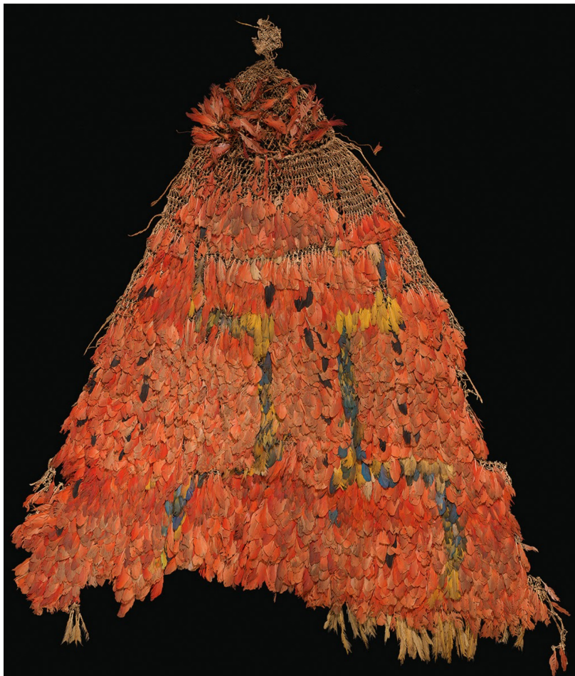
Fig. 13: Tupinambá culture, feather cloak, late sixteenth/early seventeenth century. Settala Collection. Milan, Biblioteca Ambrosiana, inv. 2605.