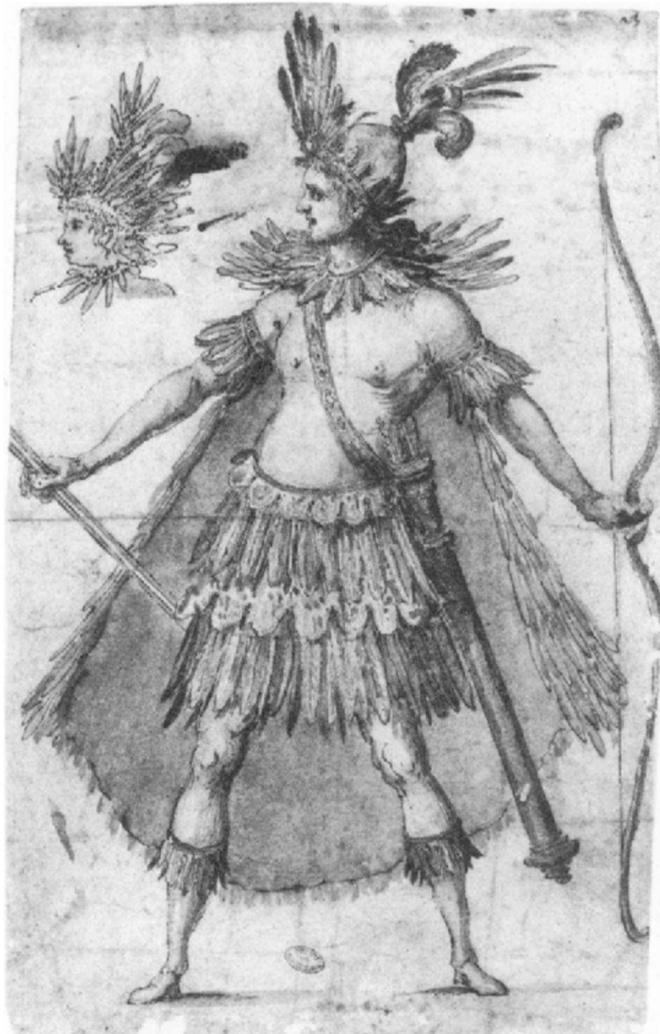
Fig. 6: Giulio Parigi, Soldato indiano della guardia della Regina Lucinda , pen, ink, and watercolour, 1616. Florence, Biblioteca Marucelliana, BMF Dis. Vol. B n. 33.