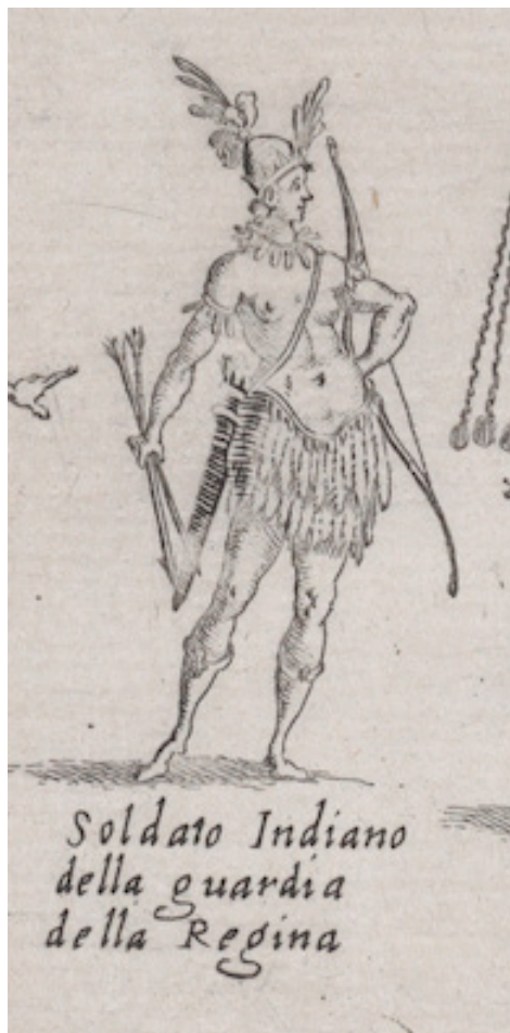
Fig. 4b: Jacques Callot, The Chariots and The Characters from la Guerra d'Amore (detail), etching, 1615.

New York, Metropolitan Museum of Art, Ac. No. 40.52.14.