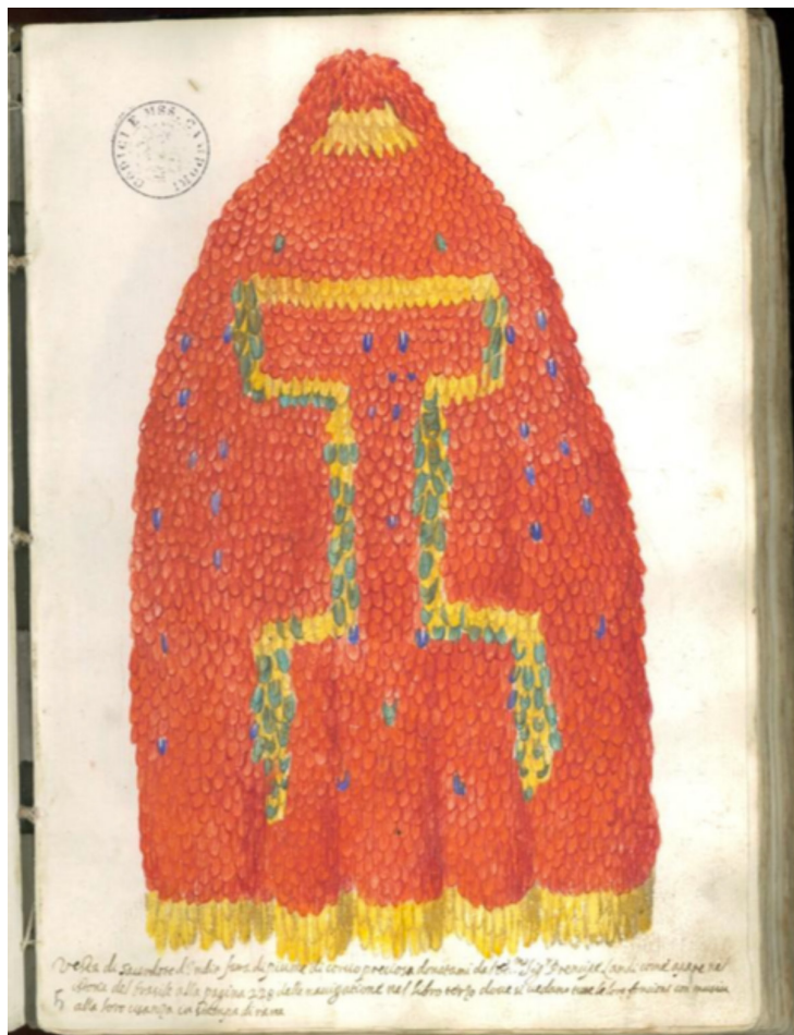
Fig. 12: Unknown Italian artist, Tupinambá feather cloak with bonnet from illustrated inventory of Manfredo Settala's collection, ca. 1640–1660. Modena, Gallerie Estensi - Biblioteca Estense Universitaria, Codici Settala (CSBE) Campori, 338 y H. I. 21 fol. 5r.