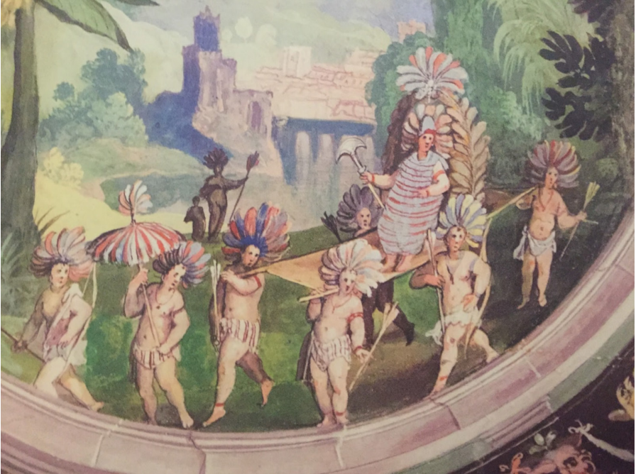
Fig. 5: Ludovico Buti, Il corteo regale di Montezuma (detail), fresco, 1588. Florence, Uffizi Gallery.