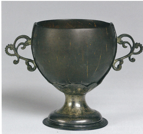
Fig. 11a: Mexican cups, coconut and silver, pre-1680. Settala Collection.

Milan, MuDEC-Museo delle Culture, inv. 02563.