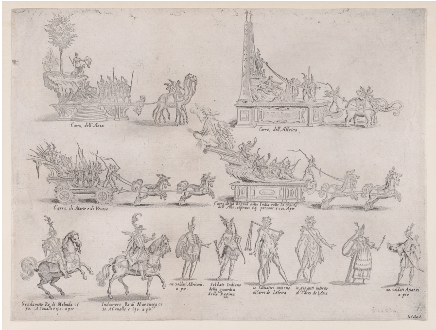
Fig. 4a: Jacques Callot, The Chariots and The Characters from la Guerra d'Amore , etching, 1615. New York, Metropolitan Museum of Art, Ac. No. 40.52.14.