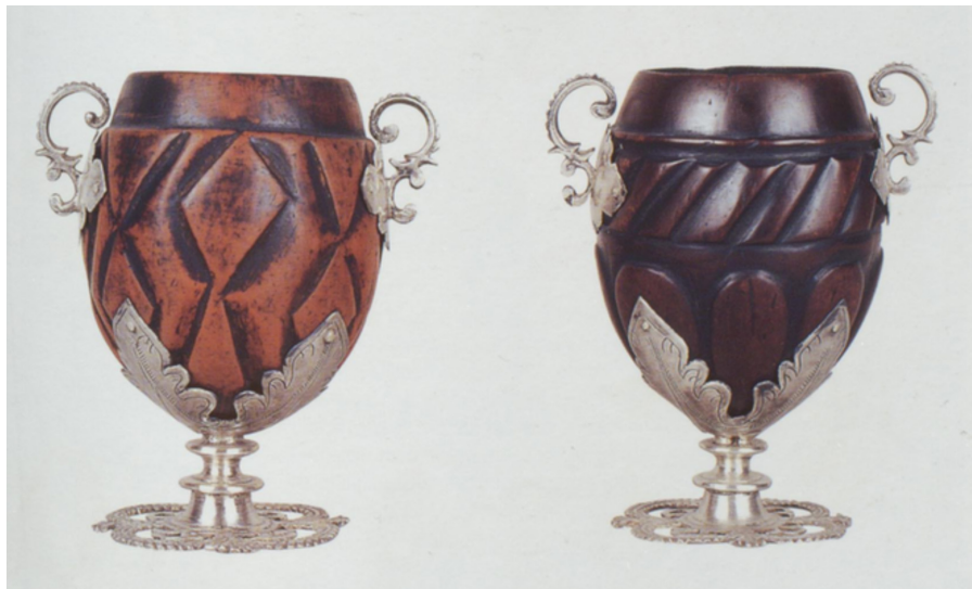
Fig. 10: Mexican cups, coconut and silver, seventeenth century. Medici Collection. Florence, Treasury of the Grand Dukes, inv. bg. 1917 nn. 5, 10.

Photo: M. Mosco, The Medici and the Allure of the Exotic , in Museo degli Argenti Collections and Collectors , ed. by M. Mosco, Firenze, 2004, pp. 168-183, p. 173.