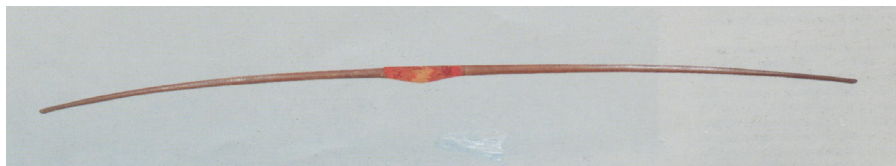
Fig. 2: Tupinambá culture, bow, wood and green silk, seventeenth century. Medici Collection. Florence, Anthropology and Ethnography Museum, inv. no. 534.