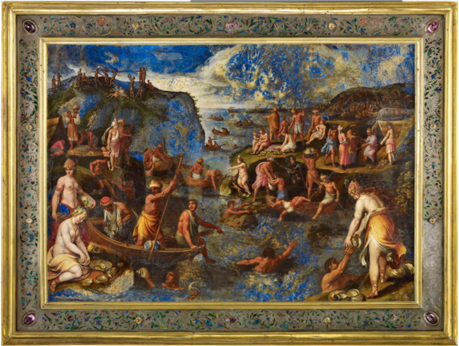
Fig. 7a: Antonio Tempesta, Pearl Fishing , oil on lapis lazuli, ca. 1610. Paris, Musée du Louvre, inv. MR Suppl. 243.