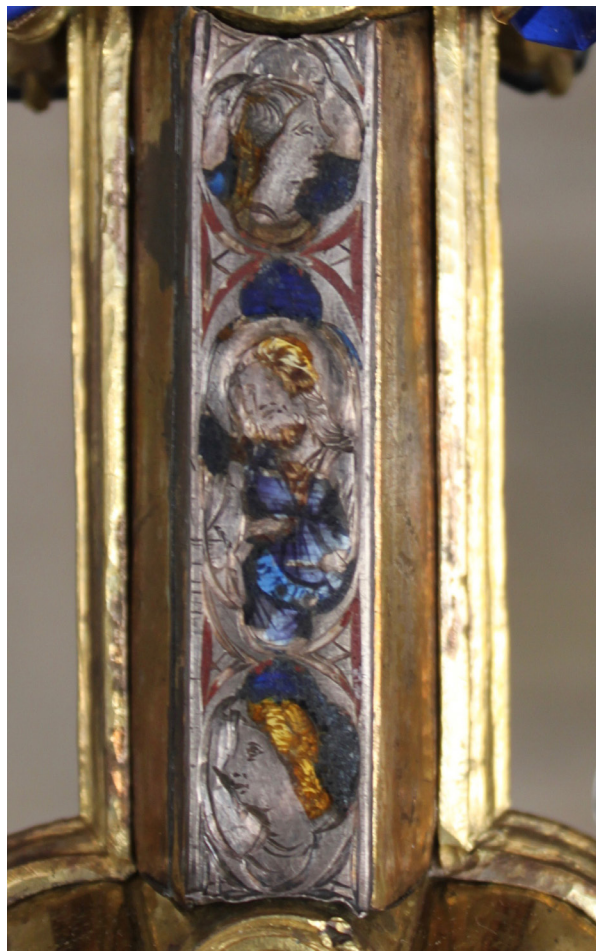
Fig. 10: Croce stauroteca , dettaglio del braccio superiore verticale, verso. San Gimignano, Museo di Arte Sacra.