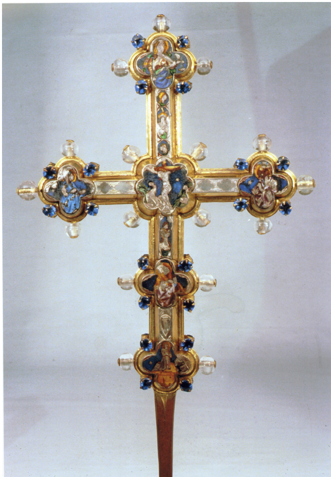
Fig. 1: Croce stauroteca, recto , ultimo quarto del XIV secolo. San Gimignano, Museo di Arte Sacra.