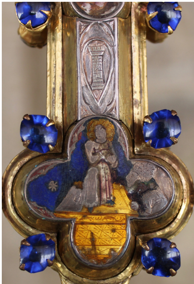
Fig. 5: Croce stauroteca , dettaglio con figura di santa. San Gimignano, Museo di Arte Sacra.