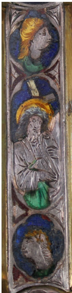
Fig. 7: Croce stauroteca , dettaglio del braccio verticale superiore, recto . San Gimignano, Museo di Arte Sacra.