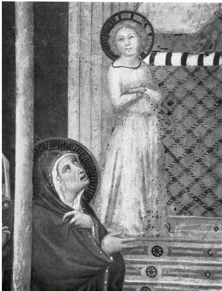
Fig. 12: Lippo Vanni, Presentazione della Vergine al Tempio , dettaglio, settimo decennio del XIV secolo. Monteriggioni, Santa Colomba, Eremo di San Leonardo al Lago.