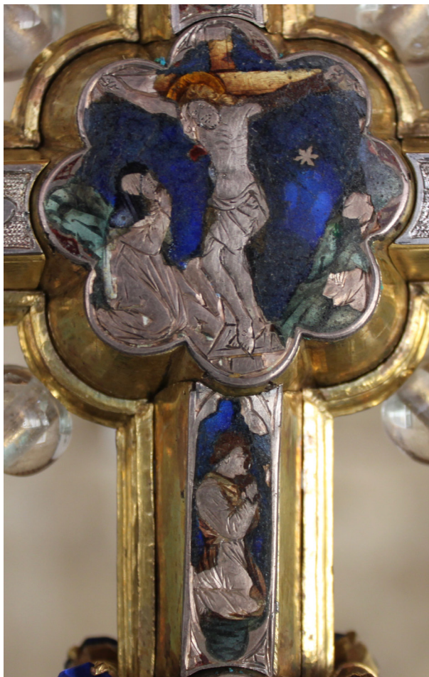
Fig. 6: Croce stauroteca , dettaglio con Crocifissione e frate in preghiera. San Gimignano, Museo di Arte Sacra.