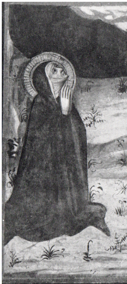
Fig. 13: Lippo Vanni, Santa Monica , dettaglio, settimo decennio del XIV secolo. Monteriggioni, Santa Colomba, Eremo di San Leonardo al Lago.