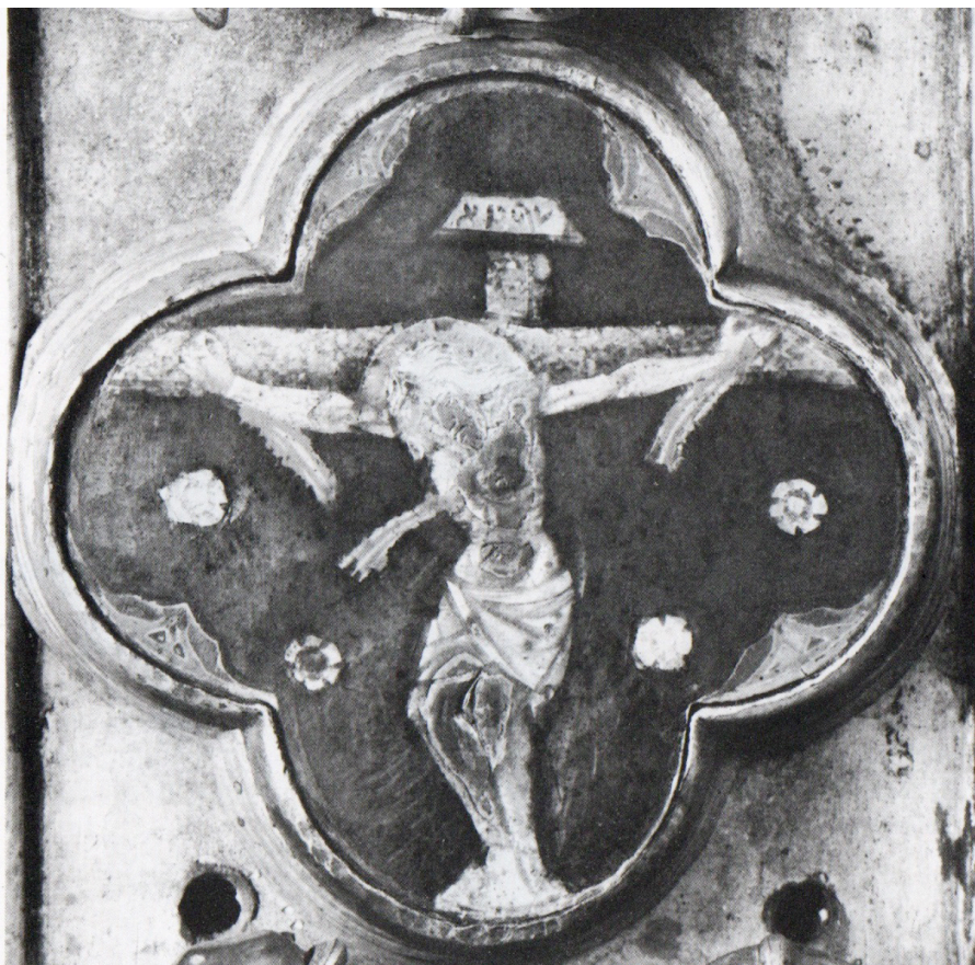
Fig. 9: Croce reliquiario , dettaglio con Crocifissione , ultimo quarto del XIV secolo. Firenze, Museo Nazionale del Bargello.