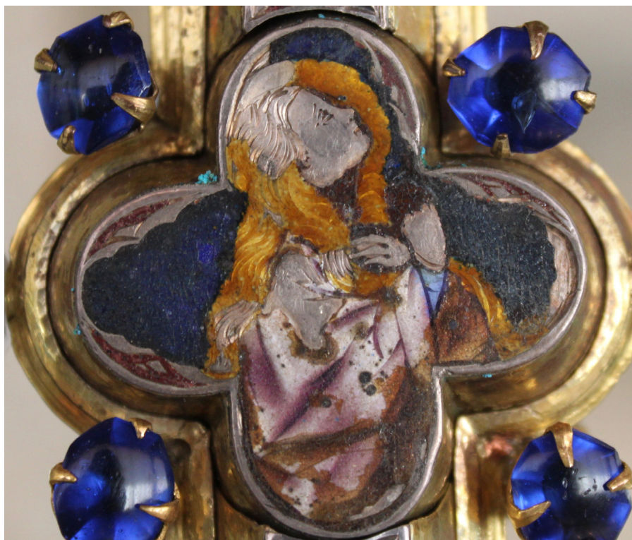
Fig. 4: Croce stauroteca , dettaglio con Maddalena. San Gimignano, Museo di Arte Sacra.