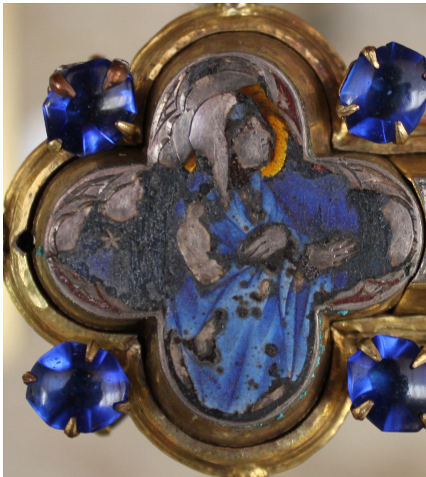
Fig. 3: Croce stauroteca , dettaglio con Vergine dolente. San Gimignano, Museo di Arte Sacra.