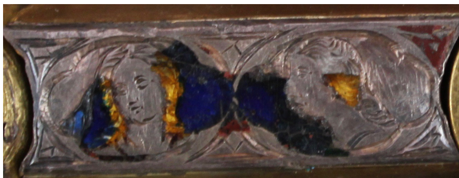
Fig. 8: Croce stauroteca , dettaglio del braccio orizzontale destro, verso. San Gimignano, Museo di Arte Sacra.