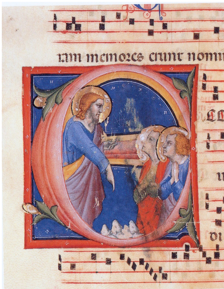
Fig. 14: Lippo Vanni, Cristo e gli apostoli , Antifonario 126, 1340-1342.