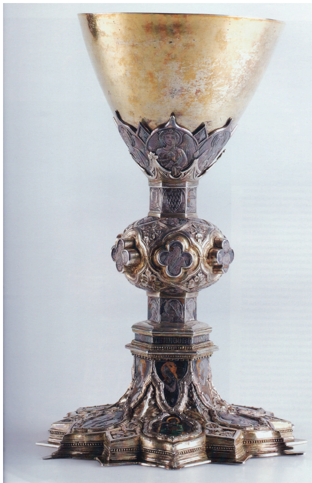
Fig. 11: Calice firmato Bartolomeo di Tommè di Ser Giannino detto Pizzino, ottavo decennio del XIV secolo. Lione, Musée des Beaux Arts.