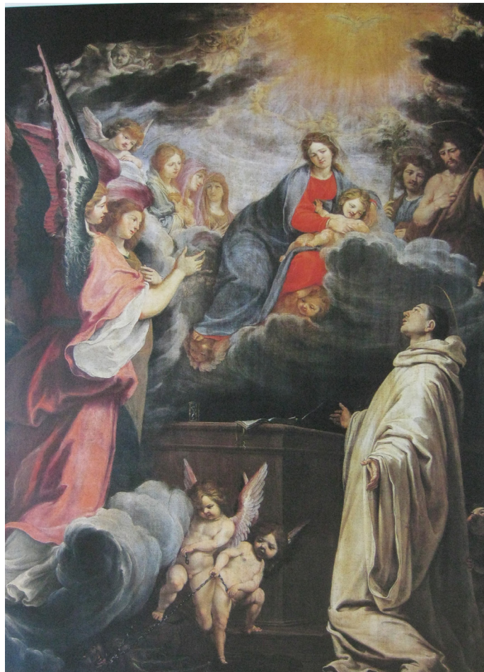
Fig. 6: Fabrizio Boschi, La Vergine appare a San Bernardo di Chiaravalle , 1630 -'31 – Firenze, Depositi delle Gallerie fiorentine