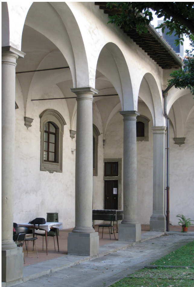
Fig. 10: Gherardo Silvani, Primo chiostro del convento del Cestello (part.) , 1628 -'30 – Firenze, Seminario Maggiore del Cestello