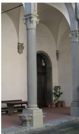
Fig. 21: Tommaso Mannelli, detto Sermei, e bottega (su disegno di Gherardo Silvani), Finestre profilate in pietra , 1630 -'33 – Firenze, Seminario Maggiore del Cestello, secondo chiostro.