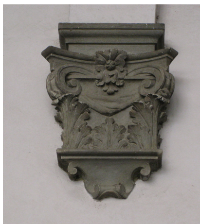
Fig. 29: Anton Francesco Barbi (su disegno di Gherardo Silvani), Peduccio scolpito con il simbolo della Badia a Settimo , 1639 – Firenze, Seminario Maggiore del Cestello, secondo chiostro