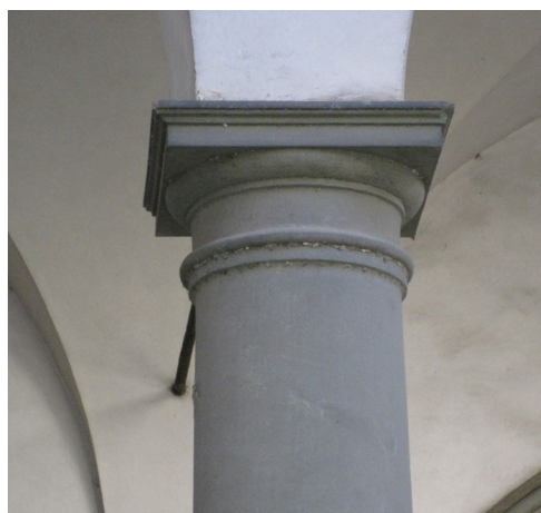
Fig. 15: Tommaso Mannelli, detto Sermei, e bottega (su disegno di Gherardo Silvani), Pilastro angolare , 1628 -'30 – Firenze, Seminario Maggiore del Cestello, primo chiostro