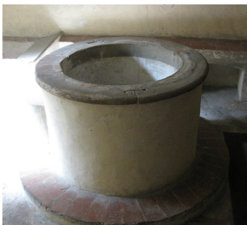
Fig. 11: Gherardo Silvani, Primo chiostro del convento del Castello (part.) , 1628 -'30 – Firenze, Seminario Maggiore del Castello