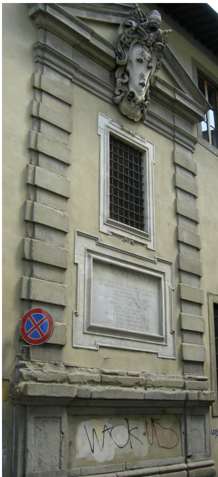
Fig. 7: Alessandro Malevisti, Targa commemorativa dello scambio dei monasteri, con stemma Barberini , 1628 – Firenze, Borgo Pinti angolo via della Condotta