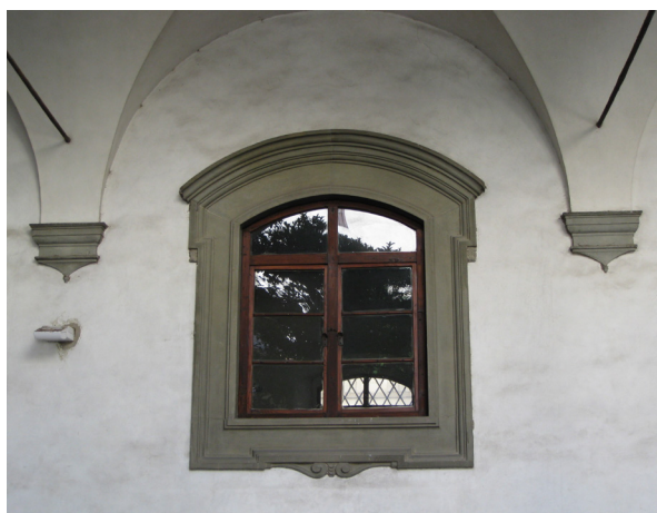
Fig. 13: Tommaso Mannelli, detto Sermei, e bottega (su disegno di Gherardo Silvani), Porta e sovrastante finestra , 1628 -'30 – Firenze, Seminario Maggiore del Cestello, primo chiostro