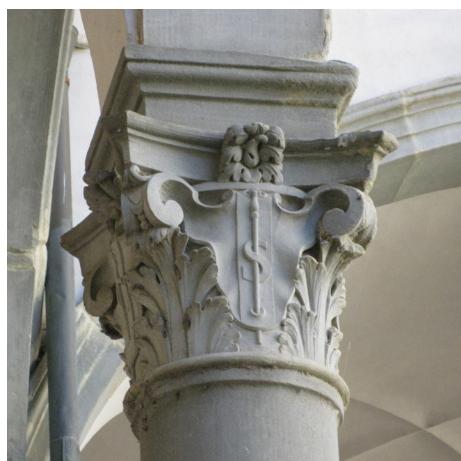
Fig. 23: Anton Francesco Barbi (su disegno di Gherardo Silvani), Capitello scolpito , 1641 – Firenze, Seminario Maggiore del Cestello, secondo chiostro