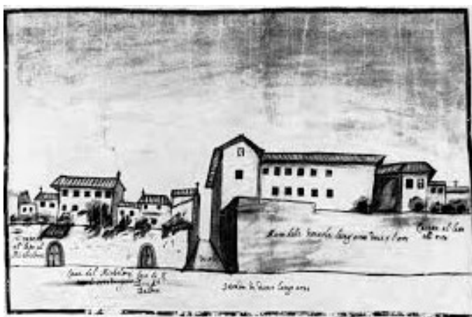
Fig. 8: Anonimo, Vicolo tra il convento e le case vicine su via di Carraia (oggi Borgo San Frediano) , ante 1628 – Careggi, monastero delle carmelitane, archivio