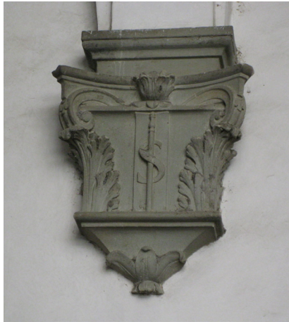
Fig. 27: Anton Francesco Barbi (su disegno di Gherardo Silvani), Peduccio scolpito con i simboli del potere dell'abate di Settimo; il pastorale (quello religioso), il bastone (quello civile) , 1639 – Firenze, Seminario Maggiore del Cestello, secondo chiostro