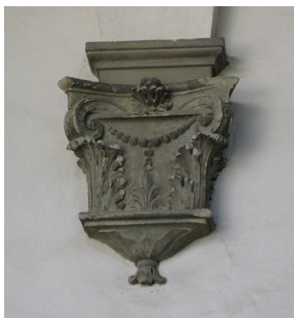
Fig. 25: Tommaso Mannelli, detto Sermei, e bottega (su disegno di Gherardo Silvani), Plinto con seduta e testa mostruosa , 1641 ca. – Firenze, Seminario Maggiore del Cestello, secondo chiostro