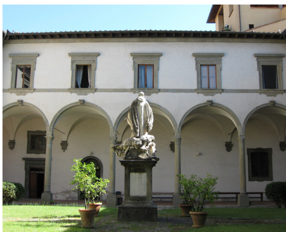
Fig. 19: Gherardo Silvani, Secondo chiostro del convento di Cestello , 1630 -'41 ca. – Firenze, Seminario Maggiore del Cestello