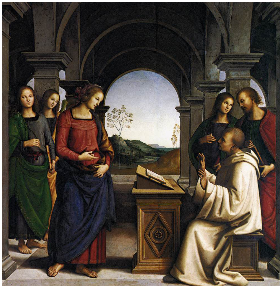
Fig. 4: Pietro Perugino, La Vergine appare a San Bernardo di Chiaravalle , 1488 -'89 – Monaco di Baviera, Alte Pinakothek