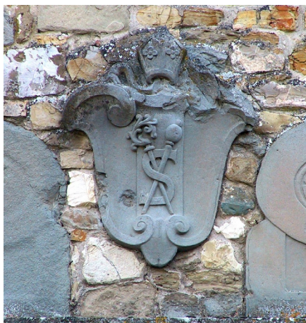
Fig. 31: Anton Francesco Barbi (su disegno di Gherardo Silvani), Peduccio scolpito , 1639 – Firenze, Seminario Maggiore del Cestello, secondo chiostro