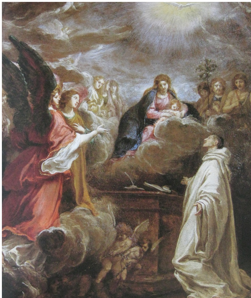
Fig. 5: Fabrizio Boschi, La Vergine appare a San Bernardo di Chiaravalle , 1630 – Collezione privata