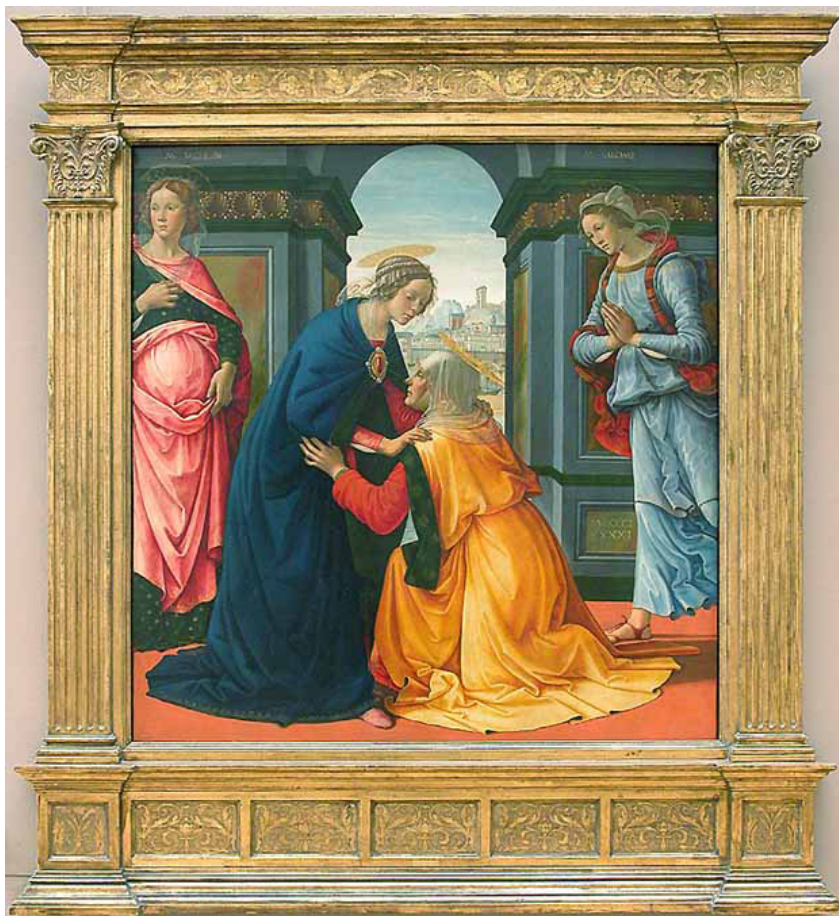
Fig. 3: Domenico Ghirlandaio e bottega, Visitazione , 1491 – Parigi, Museo del Louvre