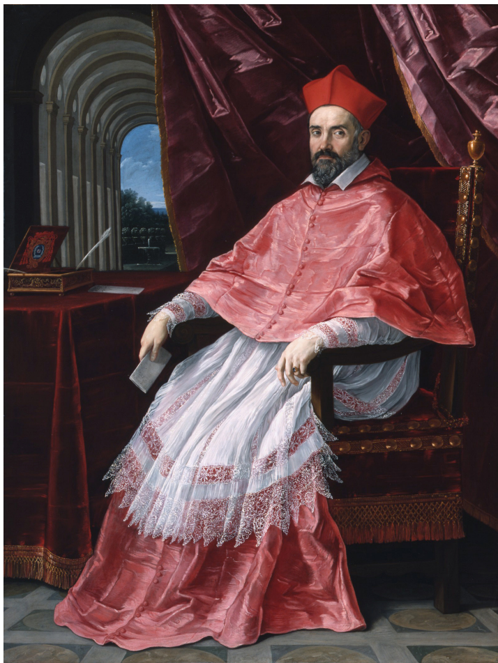
Fig. 2: Guido Reni, Ritratto del cardinale Roberto Ubaldini , 1627 – Los Angeles, Los Angeles County Museum of Art