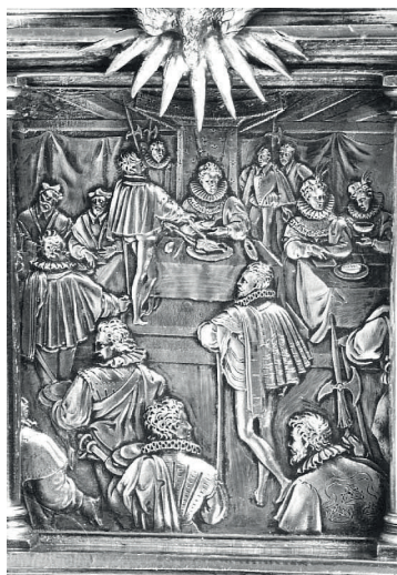
fig. 7 : FRANÇOIS II DUJARDIN, d'après Toussaint Dubreuil, Banquet de l'ordre du Saint-Esprit présidé par le roi , 1584-1595, argent doré, bas-relief ornant une masse de l'Ordre du Saint Esprit, Paris, musée du Louvre