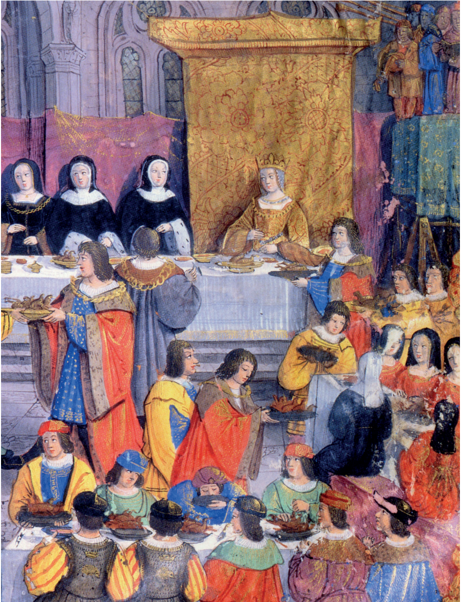
fig. 5 : Détail de la fig. 3