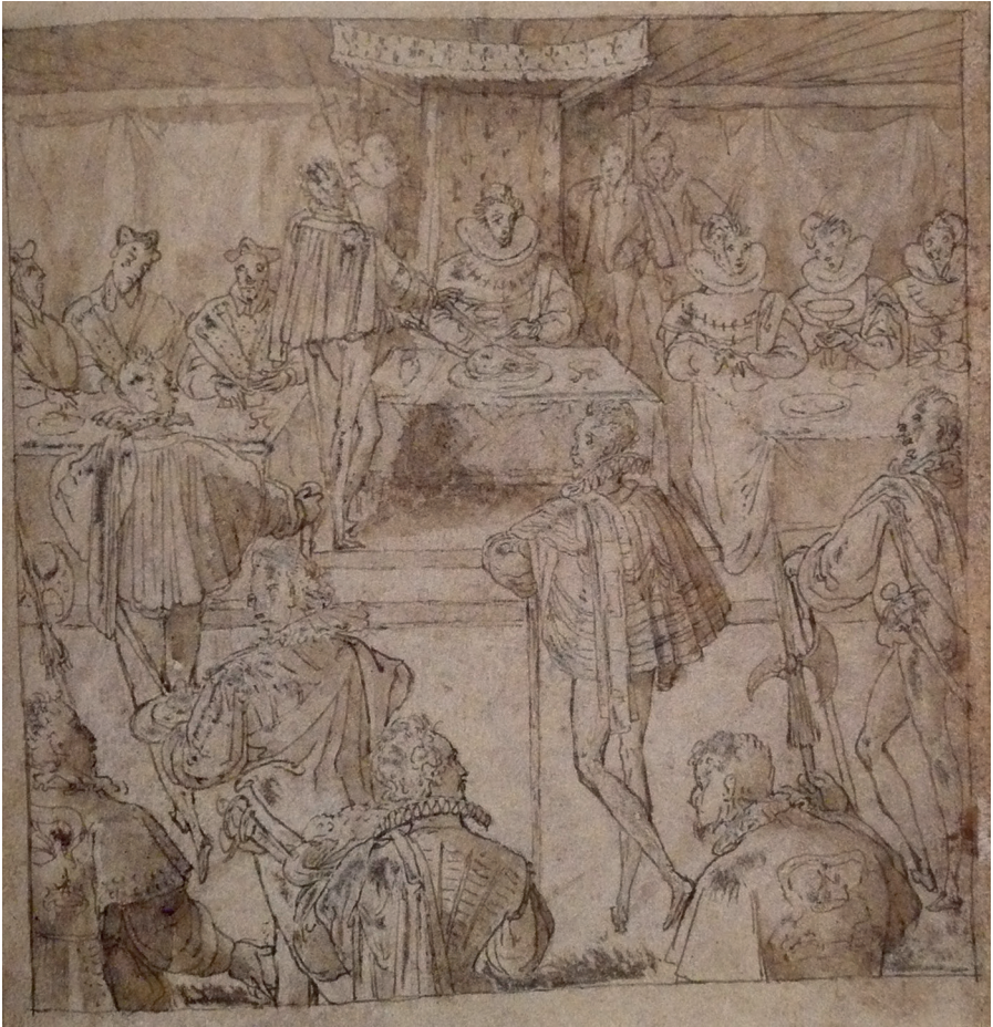
fig. 6 : TOUSSAINT DUBREUIL, Banquet de l'ordre du Saint-Esprit présidé par le roi , 1578-1585, plume et encre brune, lavis brun, rehauts de blanc, vélin, 9 x 8,4 cm, Paris, musée du Louvre, Département des Arts graphiques