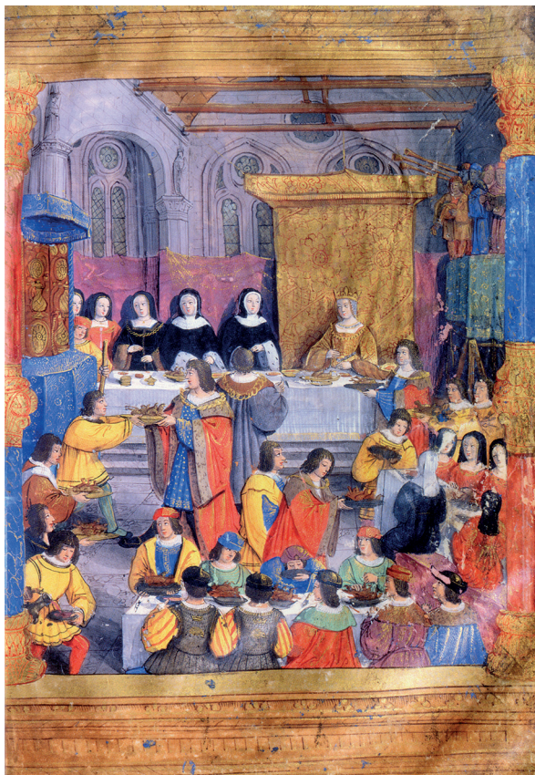
fig. 3 : MAÎTRE DE LA CHRONIQUE SCANDALEUSE, Banquet de couronnement d'Anne de Bretagne en 1504 , in André de la Vigne, Description du couronnement et de l'entrée à Paris d'Anne de Bretagne , 1505, Waddesdon Manor, collection Rothschild, ms. 22, fol. 54v