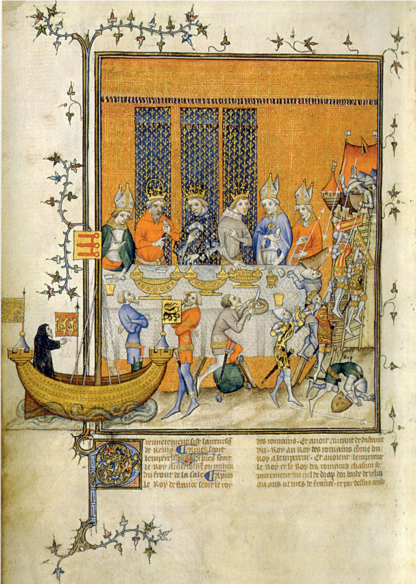
fig. 1 : ANONYME, L'empereur Charles IV et le roi de France Charles V assistent à la représentation d'une croisade , ca. 1380, enluminure, in Grandes Chroniques de France , Paris, BnF, ms. fr. 2813, fol. 473v