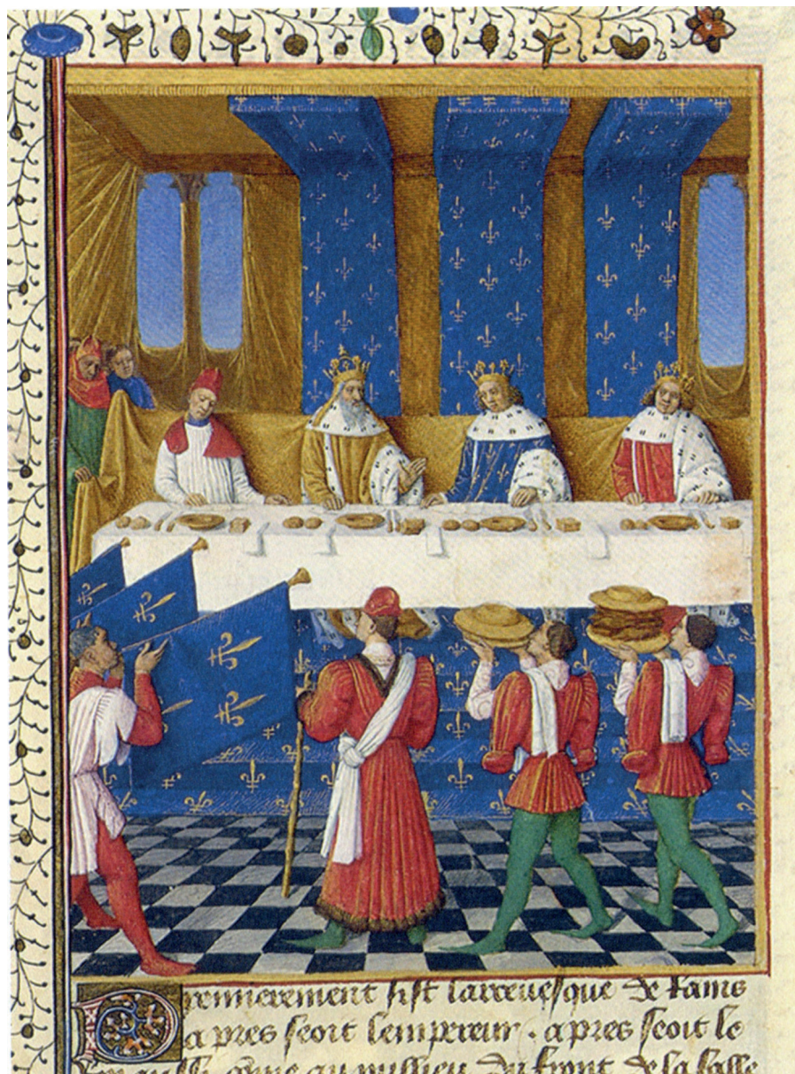
fig. 2 : JEAN FOUQUET, Banquet offert par Charles V à l'empereur Charles IV en la grande salle du Palais , ca. 1455-1460, in Grandes Chroniques de France , Paris, BnF, ms. fr. 6465, fol. 444v